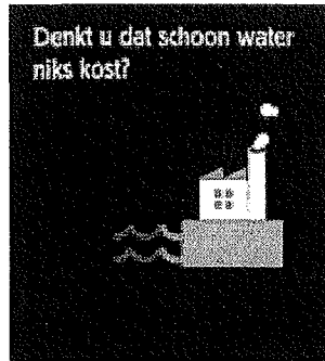
Denkt u dat schoon water niks kost? categorie Bedrijven

Met het vervallen van de koepelcampagne, verviel voor een deel de strategie om de doelgroep op drie niveaus te bereiken: massamediaal, regionaal/lokaal en individueel.