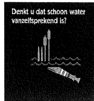
Denkt u dat schoon water vanzelfsprekend is? categorie Gebouwd