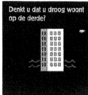
Denkt u dat u droog woont op de derde? categorie Ingezetenen