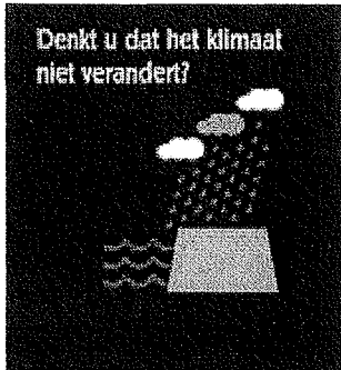
Denkt u dat het klimaat niet verandert? categorie Ongebouwd