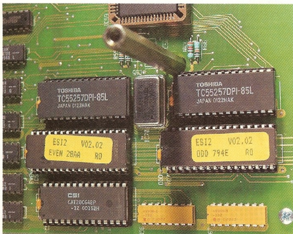
De EPROMS met de software voor de Nedap-stemmachines zijn op het moederbord eenvoudig aangebracht in sockets en kunnen makkelijk worden vervangen.

te zijn en dat impliceert een bepaalde mate van veiligheid. Het is echter niet zo dat de module en de computer onderling geen gegevens kunnen uitwisselen of dat de gegevens echt alleen maar in één richting lopen. Zo gebruikt bijvoorbeeld het stuurprogramma van de stemcomputer de gegevens over de toetsbezetting van de geheugenmodule om de kandidaten op de display weer te geven. Een fraudeur kan de software zo manipuleren dat deze zelf achterhaalt welke partij achter welke knop zit door de leesbare tekst te onderscheppen. Vervolgens kan een stem worden omgeleid naar de partij die volgens de fraudeur de verkiezingen moet winnen. Door maar een percentage van de uitgebrachte stemmen om te leiden is het ook maar de vraag of dit gaat opvallen – testen om het tegendeel te bewijzen zijn nooit uitgevoerd.