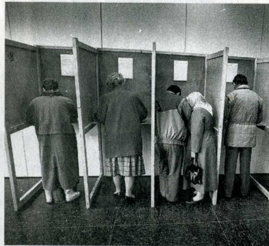
Het virtuele stemlokaal zal de traditionele stemlokalen met stemhokjes of stemmachines niet vervangen.

In de nota onderstreept Van Boxtel het grote overheidsbelang om als 'launching costumer' het tempo van het vlieg wiel der technologische ontwikkeling in Nederland te versnellen. Met het Kiezen-